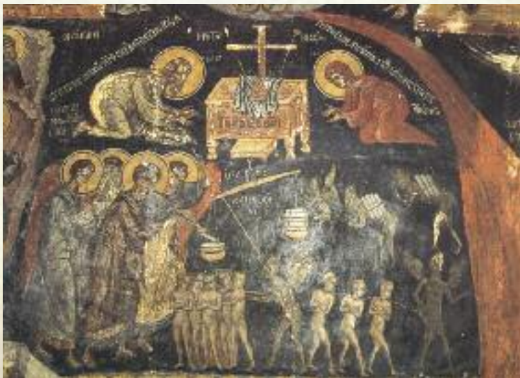
Δευτέρα Παρουσία: Ἡ ἐτοιμασία τοῦ θρόνου καὶ ἡ ψυχοστασία.

Ἐπειδὴ γὰρ ὠμῶς αὐτοῖς κέχρησαι, καὶ λέγεις, ὅτι τὰ ἐμὰ εἰς ἐμὴν ἀπόλαυσιν μόνον ἀναλωθῆναι δίκαιον, διὰ τοῦτο