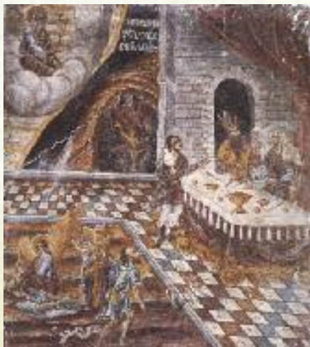
Ἡ παραβολὴ τοῦ Λαζάρου.

Ἔως πότε χρυσός, τῶν ψυχῶν ἡ ἀγχρόνη, τὸ τοῦ θανάτου ἄγκιστρον, τὸ τῆς ἁμαρτίας δέλεαρ; Ἔως πότε πλοῦτος, ἡ τοῦ πολέμου ὑπόθεσις, δι' ὃν χαλκεύεται ὄπλα, δι' ὃν ἀκονάται ξίφη; Διὰ τοῦτον συγγενεῖς ἀγνοοῦσι φύσιν, ἀδελφοὶ κατ' ἀλλήλων φονικὸν βλέπουσι διὰ τὸν πλοῦτον αἱ ἐρημίαι τοὺς φονευτὰς τρέφουσιν, ἡ θάλασσα τοὺς καταποντιστάς, αἱ πόλεις τοὺς συκοφάντας. Τίς ἐστὶν ὁ ψεύδους πατήρ; τίς ὁ πλαστογραφίας δημιουργός; τίς ὁ τὴν ἐπιτοκίαν γεννήσας; Οὐχ ὁ πλοῦτος; οὐχ ἡ περὶ τοῦτον σπουδὴ; Τί πάσχετε, ἄνθρωποι; τίς ὑμῖν τὰ ὑμέτερα εἰς τὴν καθ' ὑμῶν ἐπιβουλὴν περιέτρεψε; Συνεργία πρὸς τῷ ζῆν. Μὴ γὰρ ἐφόδια κακῶν ἐδόθη τὰ χρήματα; Λύτρον ψυχῆς. Μὴ γὰρ ἀφορμὴ ἀπωλείας; Ἀλλ' ἀναγκαῖος ὁ πλοῦτος διὰ τοὺς παῖδας. Εὐπρόσωπος ἀφορμὴ πλεονεξίας αὕτη τοὺς γὰρ παῖδας προβάλλεσθε,