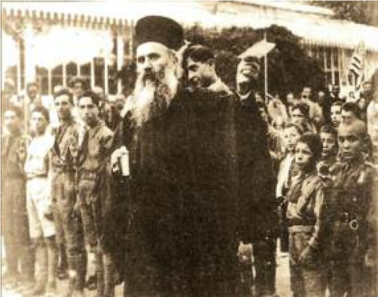
Ὁ ἐθνομάρτυς Χρυσόστομος Σμύρνης σέ ἐθνική ἐκδήλωση, μεταξὺ Ἑλλήνων προσκόπων.

Οἱ πληροφορίες πού συνελέγησαν τὴν ἐπομένη τοῦ μαρτυρικοῦ θανάτου του ἀπὸ διάφορες πηγές βεβαίωσαν, ὅτι ὁ Μητροπολίτης παραδόθηκε ἀπὸ τὸν Τούρκο Στρατιωτικό Διοικητὴ τῆς Σμύρνης Νουρεντίν Πασᾶ στὸν Τουρκικὸ ὄχλο ὁποῖος διαπομπεύσας καὶ καταβασανίσας αὐτόν, διαμέλισε τὸ σῶμα του καὶ ἔπειτα περιέφερε μὲ θρίαμβο τὴν ἀρχιερατικὴ ράβδο του στὶς Τουρκικὲς συνοικίες, διαλαλώντας τὴν παραδειγματικὴ τιμωρία τοῦ προδοτικῶς πρὸς τοὺς Τούρκους πολιτευθέντος Ἱεράρχου.