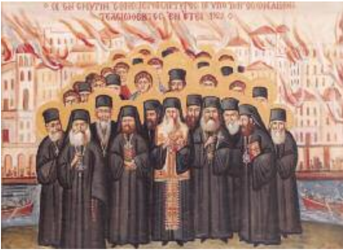
Οί ἐν Σμύρνη Ἐθνομάρτυρες.

(Εὐαγγελίστρια Ν. Ἰωνίας Βόλου, ἔργο Ζαχ. Καραφέργια)