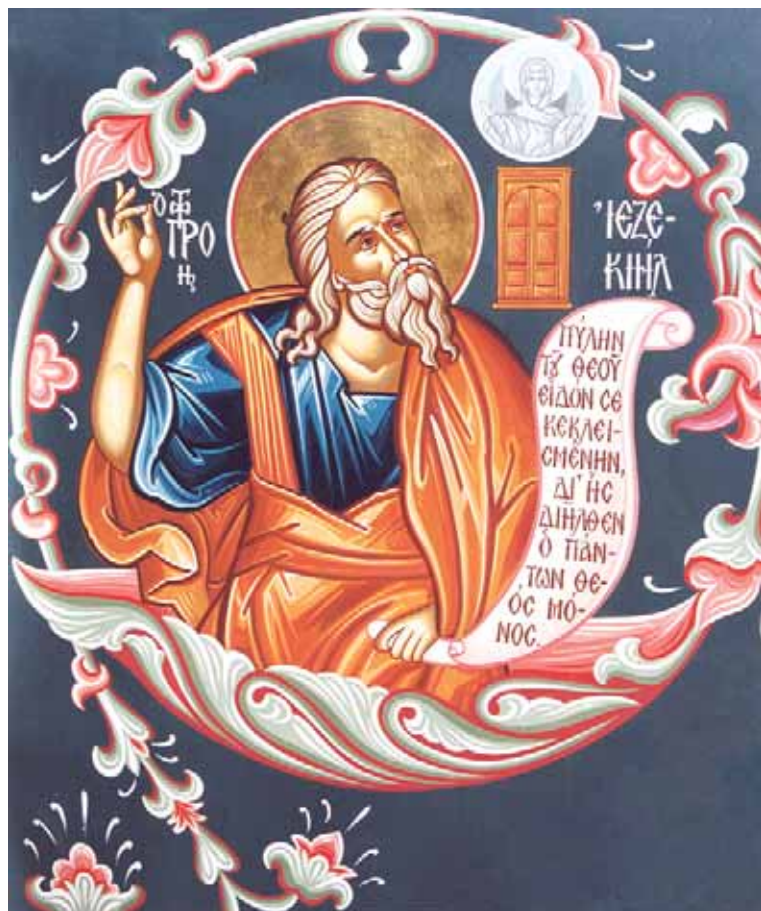
Ὁ προφήτης Ἰεζεκιήλ: Ἔργο τῶν ἀδελφῶν τῆς Ἱερᾶς Μονῆς Ἁγίου Ἰωάννου Προδρόμου, Καρέα.