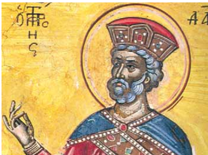
«Ὁ προφήτης Δαβίδ». Λεπτομέρεια ἀπὸ τὸν Εὐαγγελισμό. Ἀπὸ τὸ βιβλίο τῆς Ἱερᾶς Μονῆς Ἁγίου Διονυσίου.

ὄλων τῶν ὑλικῶν στοιχείων καί ὄλων τῶν γενεῶν, καί ὀλόκληρου τοῦ γένους μας καί κάθε ἀνθρώπινης φυλῆς, ὀλόκληρης τῆς δημιουργίας καί ὄλων τῶν ἐποχῶν, εἶναι τὸ μὲν ἄνθος ἢ Δέσποινα Θεοτόκος, ὁ δὲ ὠραιότατος καρπός (μιλάω φυσικὰ κατὰ τὸ ἀνθρώπινον) ὁ Υἱός της ὁ μονογενής» 61 .