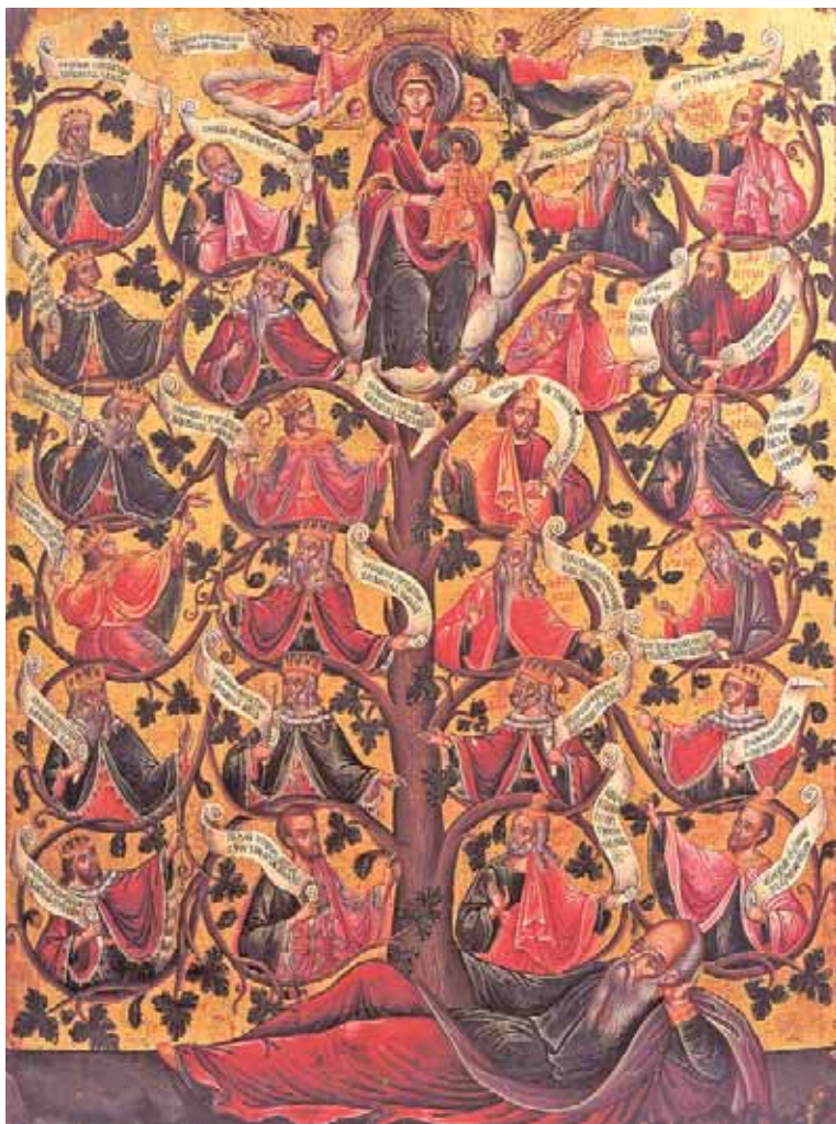
Ρίζα τοῦ Ἰεσσαί. Ἀρχές 17ου αἰώνα Πρωτᾶτο Ἀπό τὸ βιβλίο: «Θησαυροὶ τοῦ Ἁγίου Ὄρους».