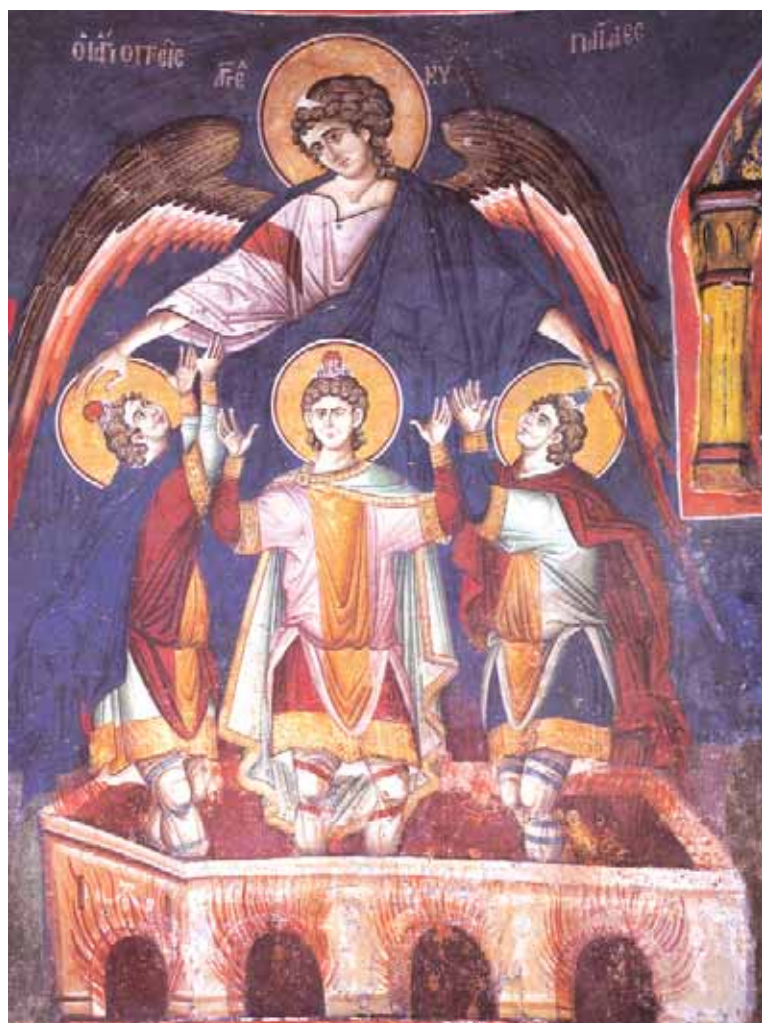
«Οἱ ἅγιοι Τρεῖς Παῖδες ἐν τῇ καμίνῳ»