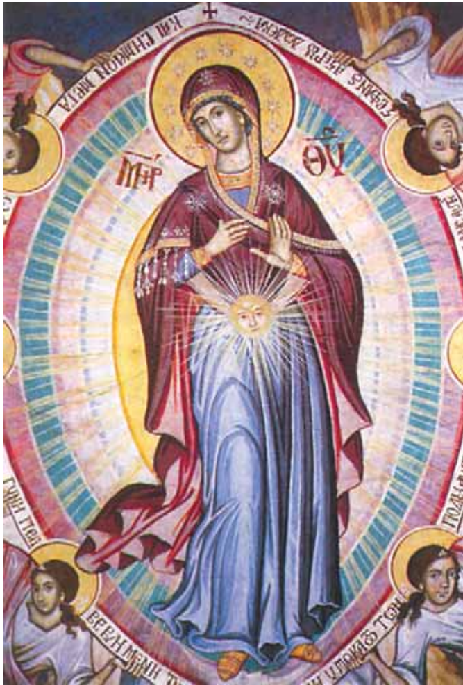
«Νύμφη κεκοσμημένη», Ἱερά Μονή Φιλοθέου, Ἅγιον Ὄρος. Εἶναι «Νύμφη κεκοσμημένη» ἢ ἄνω Ἱερουσαλήμ, «ἡτοιμασμένη» ἀπὸ τὸν Θεό.