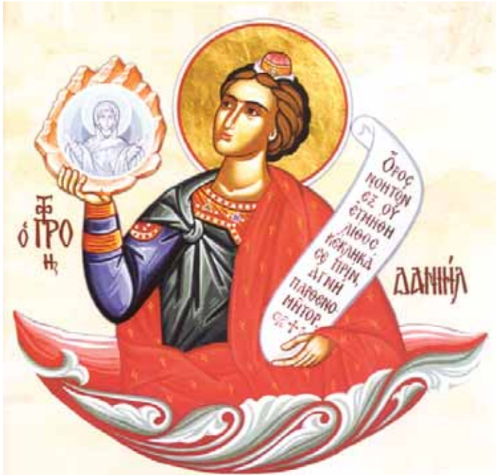
Ὁ προφήτης Δανιὴλ: Ἔργο τῶν ἀδελφῶν τῆς Ἱερᾶς Μονῆς Ἁγίου Ἰωάννου Προδρόμου, Καρέα.

Ἐπειδὴ ἡ προφητεία αὐτὴ ἀναφέρεται στὸ μυστήριον τῆς παρθενίας τῆς Μητέρας τοῦ Κυρίου διαβάζεται κατὰ τὶς Θεομητορικὲς ἑορτές.