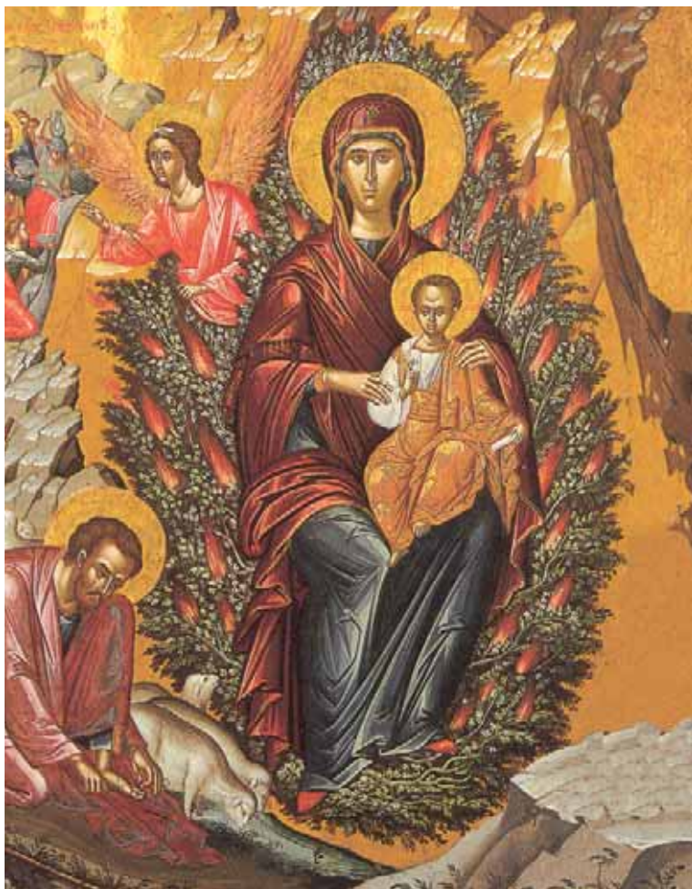
«Θεοτόκος ἢ Βάτος», Μιχαὴλ Δαμασκηνοῦ, 16ου αἰώνα. Ἀπὸ τὸ βιβλίο: «ΕΙΚΟΝΕΣ ΤΗΣ ΚΡΗΤΙΚΗΣ ΤΕΧΝΗΣ».