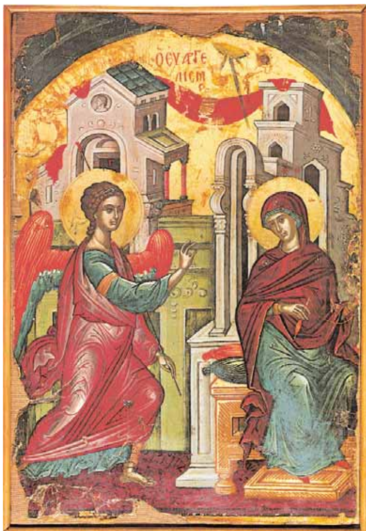
«Χαίρε κεχαριτωμένη»: Εὐαγγελισμὸς τῆς Θεοτόκου. Ἀπὸ τὸ βιβλίο «Μονὴ Σταυρονικήτα».