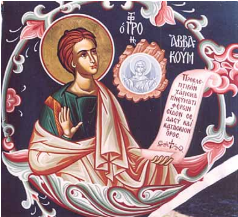
Ὁ προφήτης Ἀββακούμ: Ἔργο τῶν ἀδελφῶν τῆς Ἱερῶς Μονῆς Ἁγίου Ἰωάννου Προδρόμου, Καρέα.