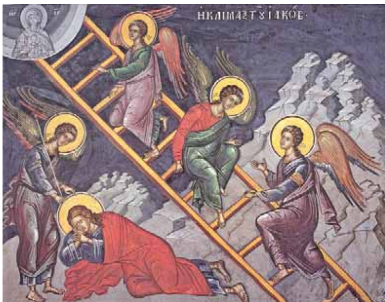
Ἡ κλίμαξ τοῦ Ἰακώβου. Ἀπὸ τὸ βιβλίο τῆς Ἱερᾶς Μονῆς Ἁγίου Διονυσίου: Οἱ Τοιχογραφίες τοῦ Καθολικοῦ.

Αὐτὴ εἶναι ἡ πρώτη ἀναφορὰ ποὺ γίνεται στὸ ἱερὸ κείμενο γιὰ τὸ θεομητορικὸ πρόσωπο καὶ τὸ μυστήριο τῆς σαρκώσεως. Ἡ προφητεία ἀναφέρει τὸ σπέρμα τῆς γυναίκα. Εἶναι γνωστὸ ὅτι ἡ γυναίκα δὲν διαθέτει τὸ σπέρμα, ἀλλὰ ὁ ἄνδρας. Αὐτὴ ὅμως εἶχε σπέρμα καὶ μάλιστα παναμώμητο, διότι γέννησε ἄνευ σπορᾶς ἄνδρός.